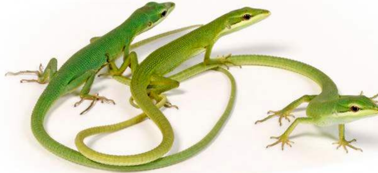
Takydromus dorsalis Jungtiere